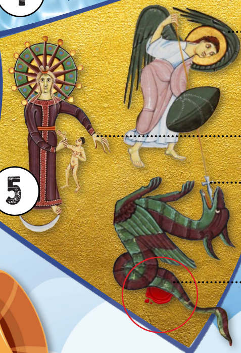
L' ange Michel